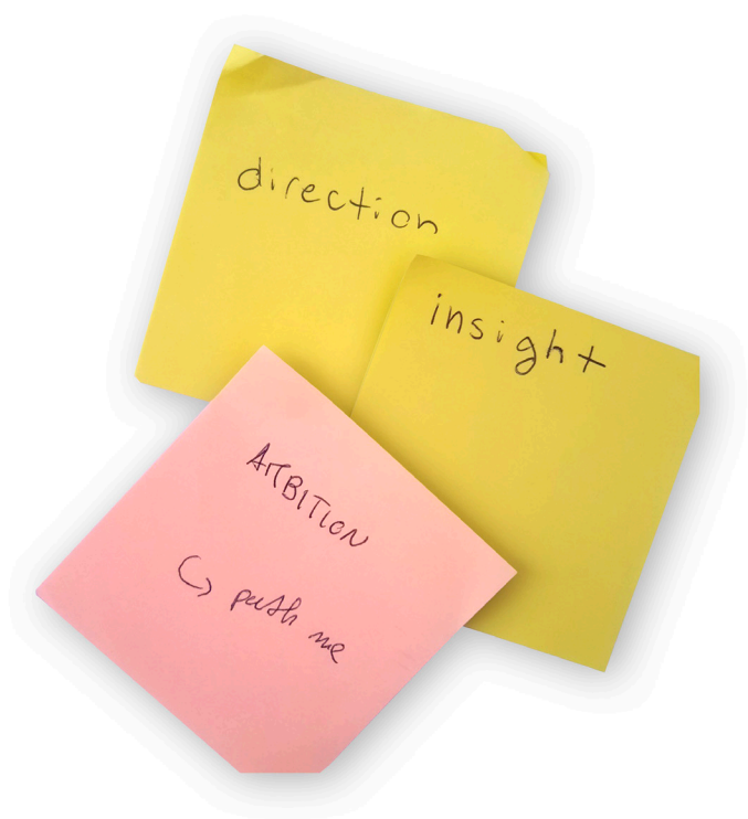
Figura 2: immagine di post-it del focus group (novembre 2022)